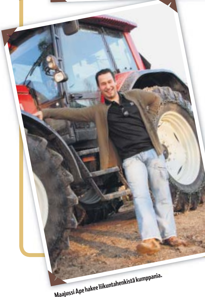
Maajussi Ape hakee liikuntahenkistä kumppania.